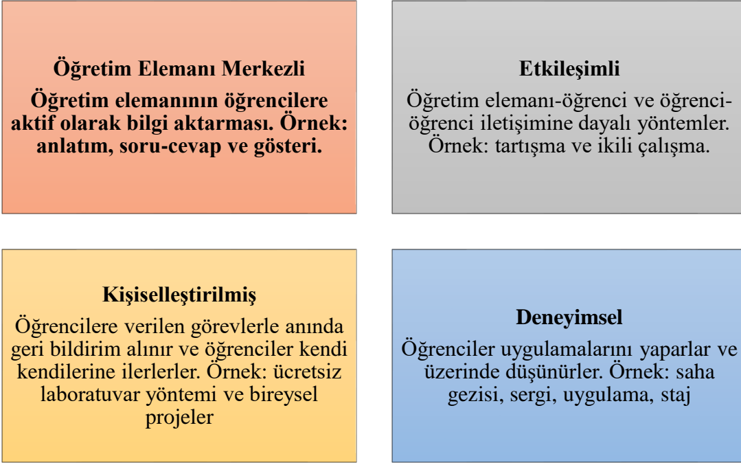
Şekil 1. Öğrenme Yöntemleri Sınıflandırması

Kullanılacak belirli bir yönteme karar verirken,